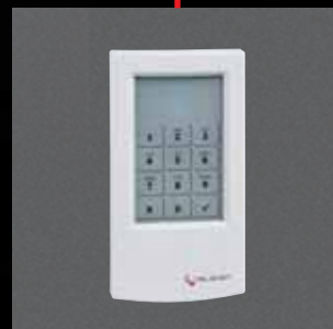
Intelligente Schalteinrichtung/ Zutrittskontrolle